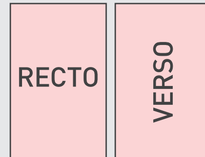
Carte R° vertical / Carte V° vertical