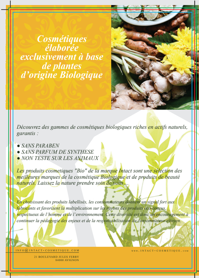
Fichier dans gabarit