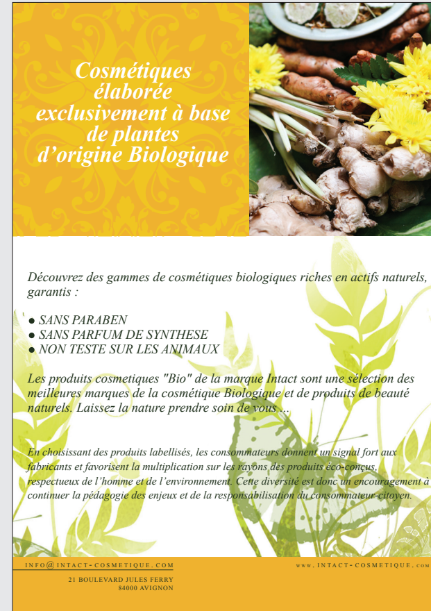
Fichier au format fini (après découpe)